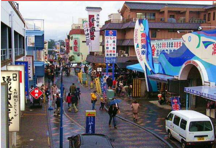
【沼津港・沼津魚市場】

近海沿岸漁業基地として発展し、静岡県東部の拠点市場として躍進しており、外港の水揚げ量は静岡で2位を誇ります。